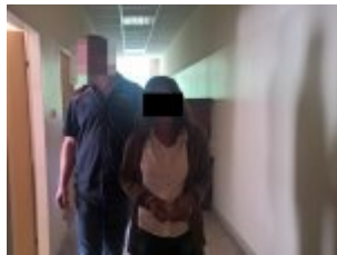
Kobieta zatrzymana przez policjantów