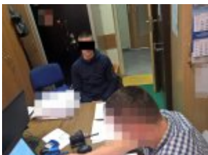
Policjant wykonuje czynności z zatrzymanym mężczyzną